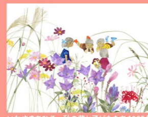
いわさきちひろ 秋の花と子どもたち 1965年

練馬区ゆかりの絵本画家いわさきちひろは、四季折々の草花に重ねて子どもたちを描きました。ちひろが描いた秋のいろいろを複製画でご紹介します。ちひろの絵本もお楽しみください。