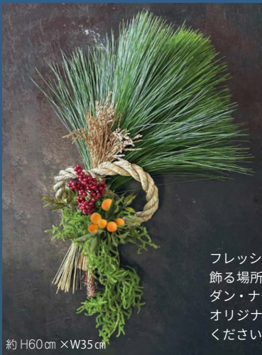
約 H60cm × W35cm