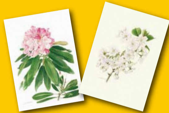
「アズマシャクナゲ」 太田洋愛 「伊豆吉野」 太田洋愛