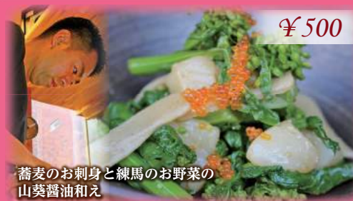
蕎麦のお刺身と練馬のお野菜の 山葵醤油和え