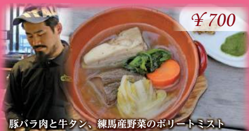
豚バラ肉と牛タン、練馬産野菜のポリートミスト ~野菜のピューレとマスタードを添えて~