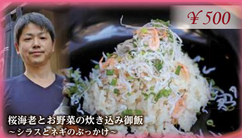
桜海老とお野菜の炊き込み御飯 ~シラスとネギのぶっかけ~