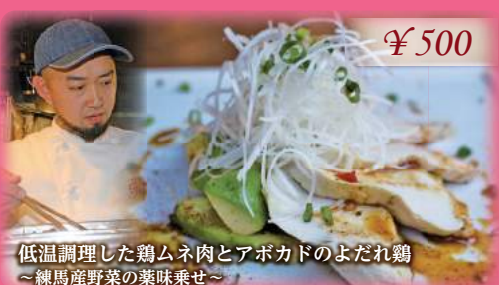
低温調理した鶏ムネ肉とアボカドのよだれ鶏 ~練馬産野菜の葉味乗せ~