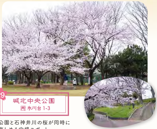
29 城北中央公園 所 氷川台1-3