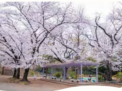
31 高稲荷公園の桜 所 桜台6-40-1