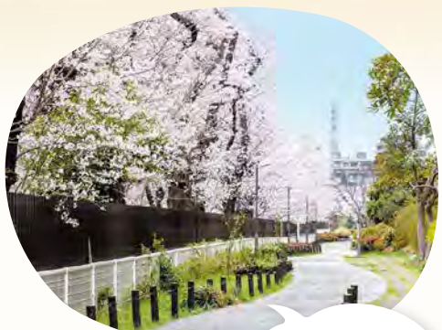
28 田柄川緑道 所 北町2~3