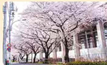
22 千川通り 所 桜台4