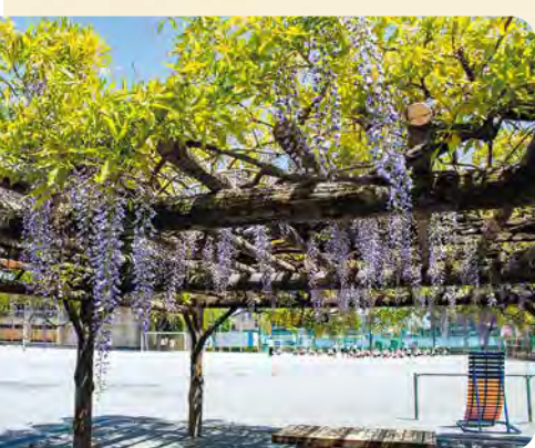
32 練馬東小学校フジ棚 所 春日町1-30-11

田柄川緑道 旧田柄川が暗きよ化され、整備された遊歩道。ジョギングや散歩道として親しまれている。春は桜、秋は紅葉がきれい。