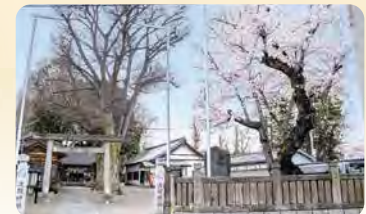
21 江古田浅間神社 所 小竹町1-59

大きなケヤキと桜の木が境内にある。重要有形民俗文化財「江古田の富士塚」が保存されています