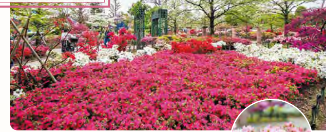
23 平成つつじ公園 所 練馬1-17-6

約600品種・約10,000株のツツジが栽培されています。1994年の開園記念で「練馬の鏡(かがみ)」と命名された久留米ツツジ(右画像)