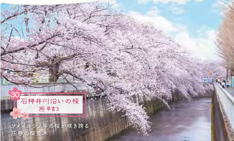
30 石神井川沿いの桜 所 早宮3