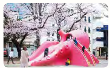
25 豊玉公園 (通称:タコ公園) 所 豊玉北6-8-3