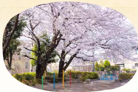
13 関町北公園 所 関町北 5-12-1