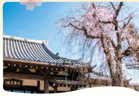
12 法融寺本堂とシダレ桜 所 関町東 1-4-16

樹齢を重ね、わずかに鮮やかな花を咲かせる老木のシダレ桜。美しい自然の力を感じます