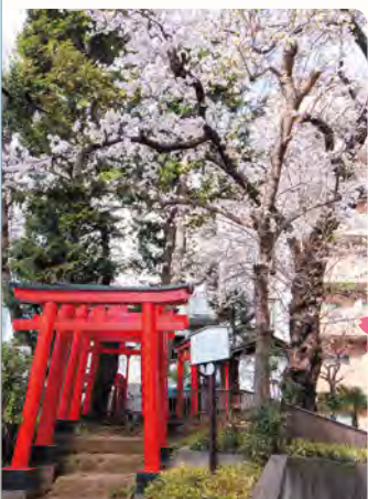
15 井口稲荷神社 所 関町北 2-32-15

樹齢を重ね、わずかに鮮やかな花を咲かせる老木のシダレ桜。美しい自然の力を感じます