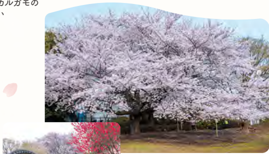
16 立野公園の桃花源 所 立野町 32-1