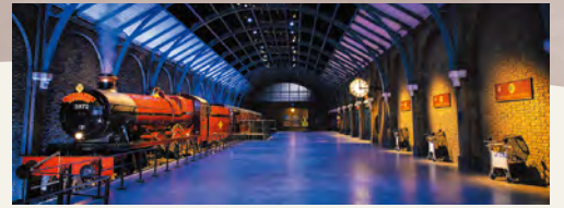
9と3/4番線ホームに停車するホグワーツ特急 "Wizarding World" and all related names, characters and indicia are trademarks of and © Warner Bros. Entertainment Inc. - Wizarding World publishing rights © J.K. Rowling.

世界中のファンから愛されている映画「ハリ・ポッター」や「ファンタスティック・ビースト」シリーズの映画制作の舞台裏を体験できる、ウォークスルー型の全く新しいエンターテインメント施設となっています。