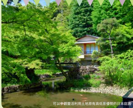
可以參觀靈活利用土地原有高低差優勢的日本庭園