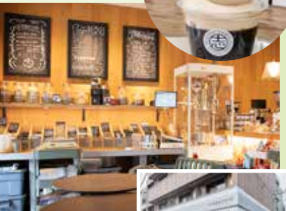
店內列有約35種特製咖啡