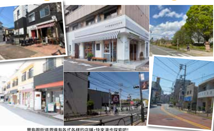
豐島園街道周邊有各式各樣的店舖，快來漫步探索吧!