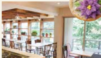
店内空间舒适宽敞，氛围自然。

接下来介绍一些散步途中，想要喘口气放松时的推荐景点。 随心选择一个地方，沉浸在旅途的回忆中，放松一下吧。