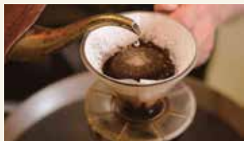
店内饮用需预约。定期举办茶饮课程。