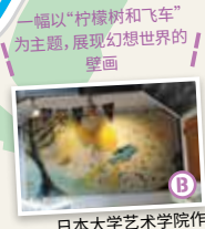
日本大学艺术学院作

入口处示意图 'Wizards World' and all related names, characters and indicia are trademarks of and © Warner Bros. Entertainment Inc. - Wizards World publishing rights © J.K. Rowling. “东京华纳兄弟哈利波特影城”，是世界第2个，亚洲首个开放的，能够真切体验“哈利波特”、“神奇动物在哪里”系列制作幕后的设施。