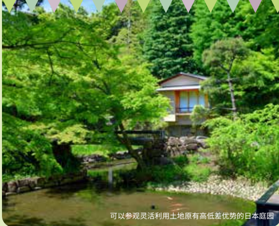
可以参观灵活利用土地原有高低差优势的日本庭园