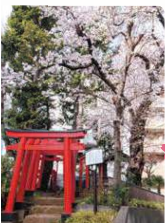
15 井口稲荷神社 所 関町北 2-32-15

樹齢を重ね、わずかに鮮やかな花を咲かせる老木のシダレ桜。美しい自然の力を感じます