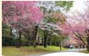
5 大泉さくら運動公園 開花時期 大泉学園町9-4-5