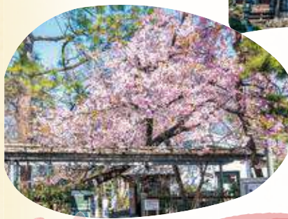
2 妙福寺のシダレ桜 開花時期 南大泉5-6-56