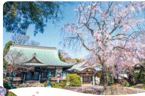
1 牧野記念庭園の オオカンザクラ 開花時期 東大泉6-34-4