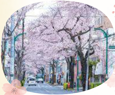
3 大泉学園通りの桜並木 開花時期 大泉学園町6