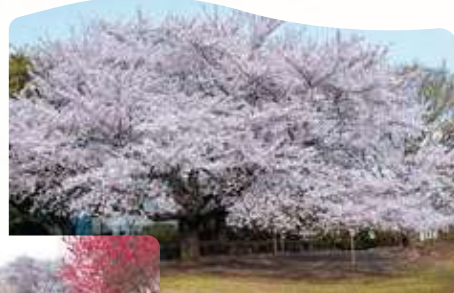
16 立野公園の桃花源 所 立野町 32-1