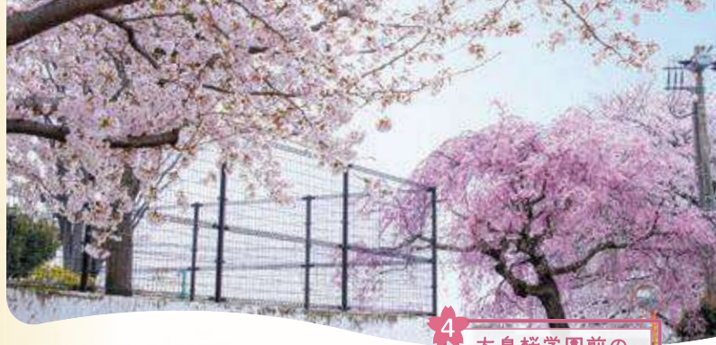
4 大泉桜学園前の ソメイヨシノとシダレ桜 開花時期 大泉学園町9