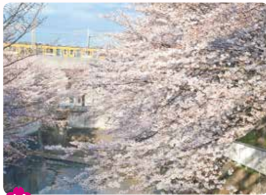
14 石神井川の桜と西武池袋線 南田中 3-31