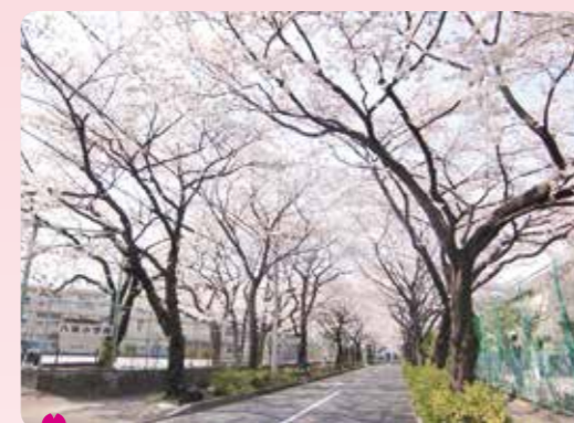
6 八坂小学校付近の桜並木 土支田 4-48