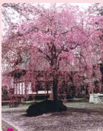
4 妙福寺のシダレ桜 南大泉 5-6