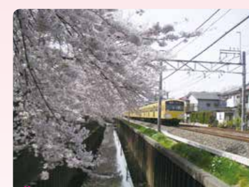
9 石神井川の桜と西武新宿線 関町北 3