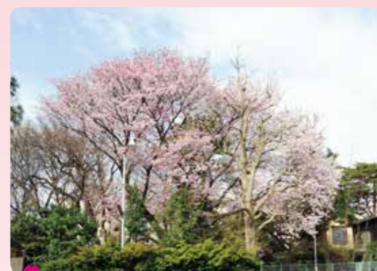
5 牧野記念庭園のセンダイヤ(サクラ) 東大泉 6-34