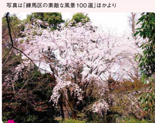
19 武蔵学園のシダレ桜 豊玉上 1-26 ※整備中