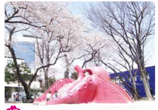
17 豊玉公園(通称:タコ公園) 豊玉北 6