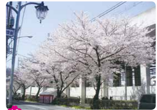
16 千川通り 桜台 4