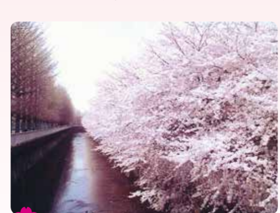
21 石神井川沿いの桜(大橋) 練馬 2