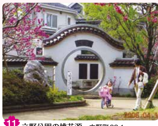
11 立野公園の桃花源 立野町 32-1