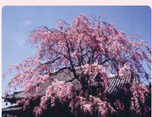
8 法融寺本堂とシダレ桜 関町東 1-4