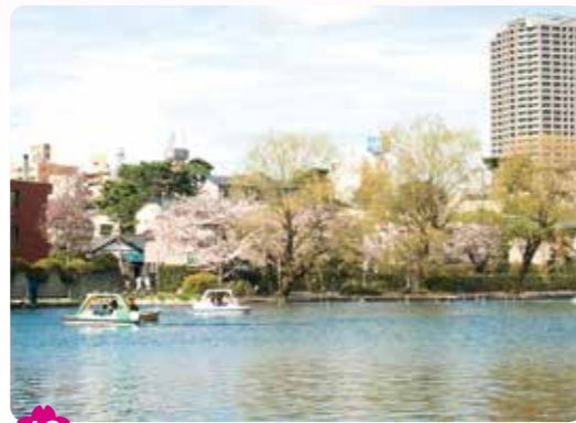
13 石神井公園の桜と緑 石神井町 5