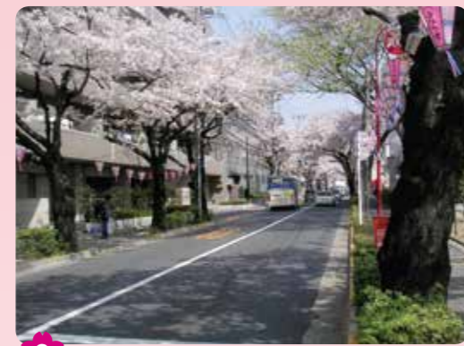
3 大泉学園通りの桜並木 大泉学園町4