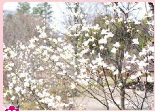
29 マグノリア園(四季の香公園内) 光が丘 6