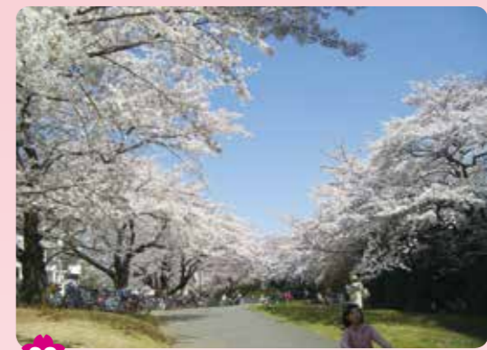
28 夏の雲公園 光が丘 3