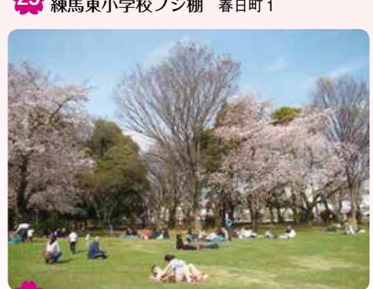
23 城北中央公園 氷川台 1-3