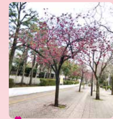
2 大泉桜学園前のカンヒザクラ 大泉学園町9