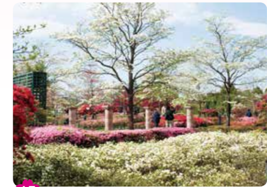
15 平成つつじ公園 練馬 1-17