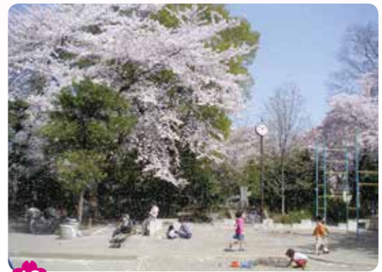
18 徳殿公園の桜吹雪 豊玉南 1-16