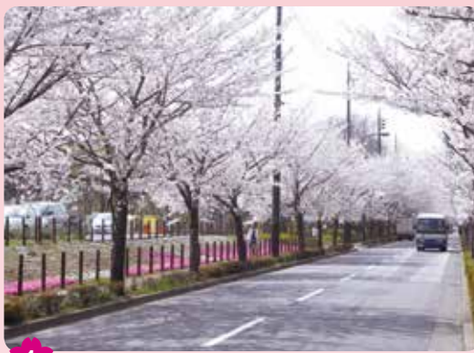
1 大泉さくら運動公園の桜並木 大泉学園町9