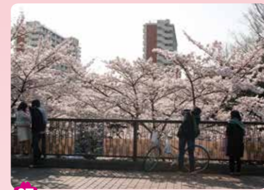
27 光が丘公園南側 光が丘 4