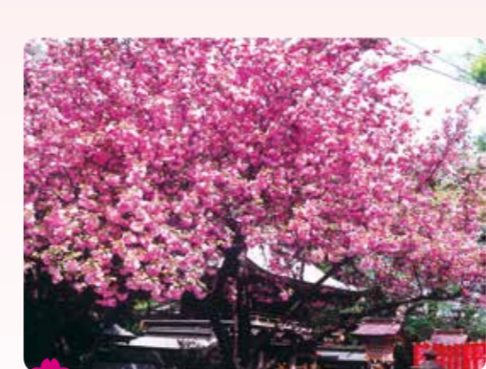
20 武蔵野稲荷神社の八重桜 栄町 10