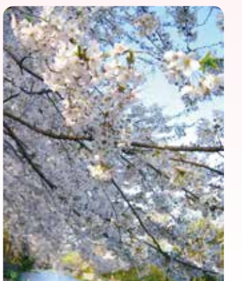
10 武蔵関公園 関町北 3-45