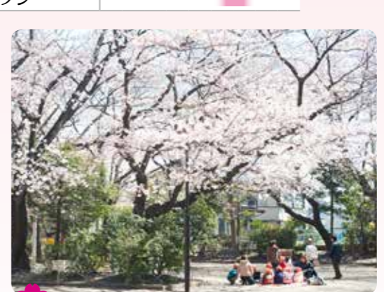
22 高稲荷公園の桜 桜台 6