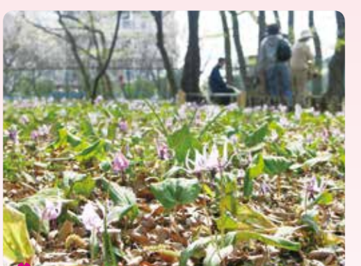
7 清水山の森のカタクリ 大泉町 1-6